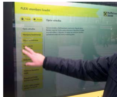
CityTouch instalacija u Zagrebu | Klijent: RBA